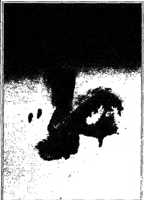
عملان لرافع الناصري